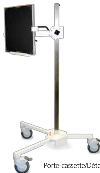
Porte-cassette/Détecteur latéral roulant