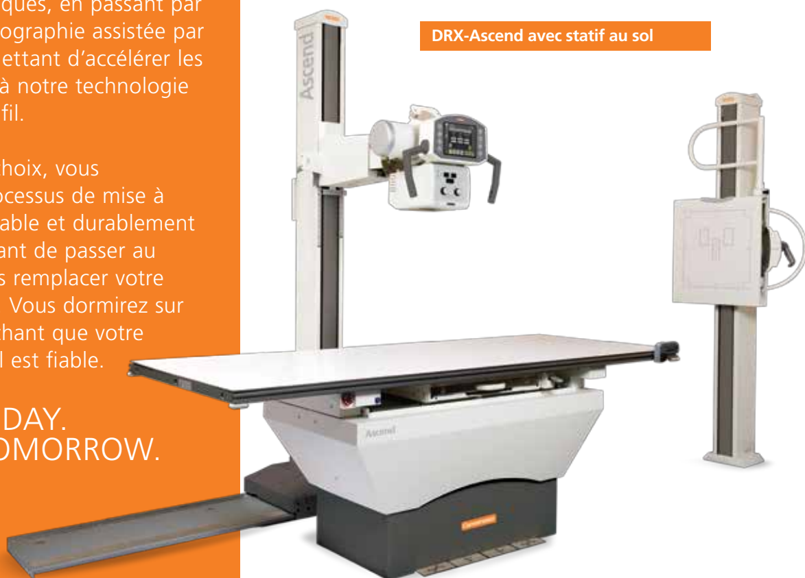
DRX-Ascend avec statif au sol