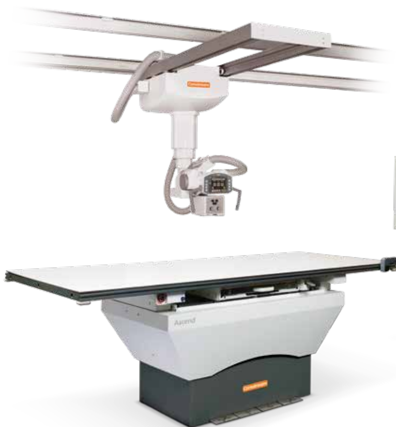
DRX-Ascend avec statif à suspension plafonnrière

La bonne nouvelle ? Pour chaque évaluation menée, il existe une configuration Ascend adaptée.