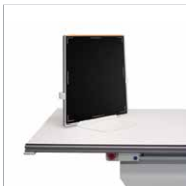
Porte-cassette/Détecteur de table