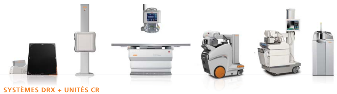
SYSTÈMES DRX + UNITÉS CR