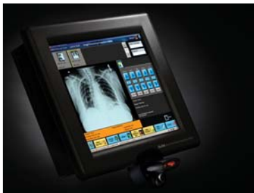
Console d'utilisation à distance

*Pour connaître les fonctions standard et en option d'un produit Carestream en particulier, consultez le représentant commercial de votre région.